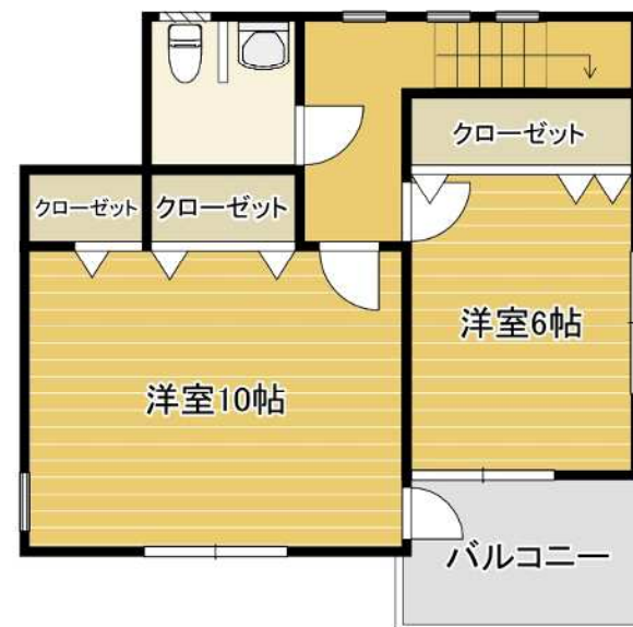
間取図 (熊本市南区富合町菰江)